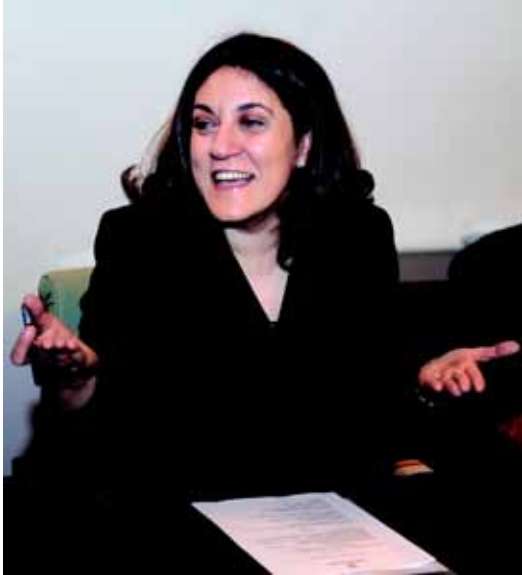
Catuscia Marini Presidente Regione Umbria

L'Umbria è orgogliosa di ospitare la terza edizione del "Campionato Italiano tiro a volo disabili fisici" e con piacere rivolgo a nome mio personale, e della Giunta