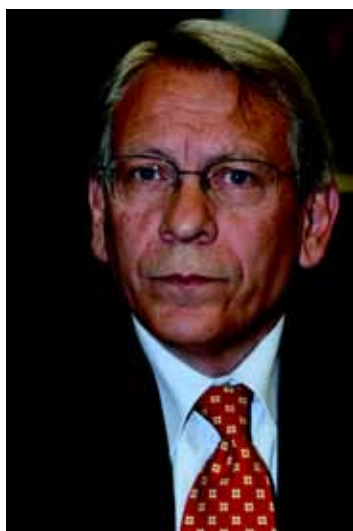
Fabrizio Bracco Assessore allo Sport Regione Umbria

Lo sport incarna valori e pratiche che possono aiutare a superare ogni mancanza se, tenendo bene a mente le radici educative ed etiche, si pensa allo sport come cura di sé nel fisico e nel morale dell'uomo e come occasione di socialità e relazione con gli altri.